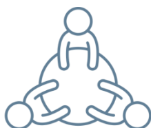
功能性委員會 成員